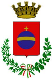
Città di Orbassano

Nell'ambito della XVIII edizione del Valsusa Filmfest