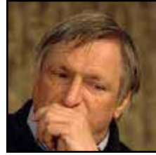
Don Luigi Ciotti