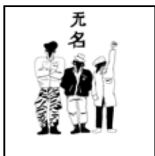
Wu Ming 1