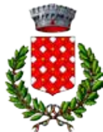
Comune di Bardonecchia